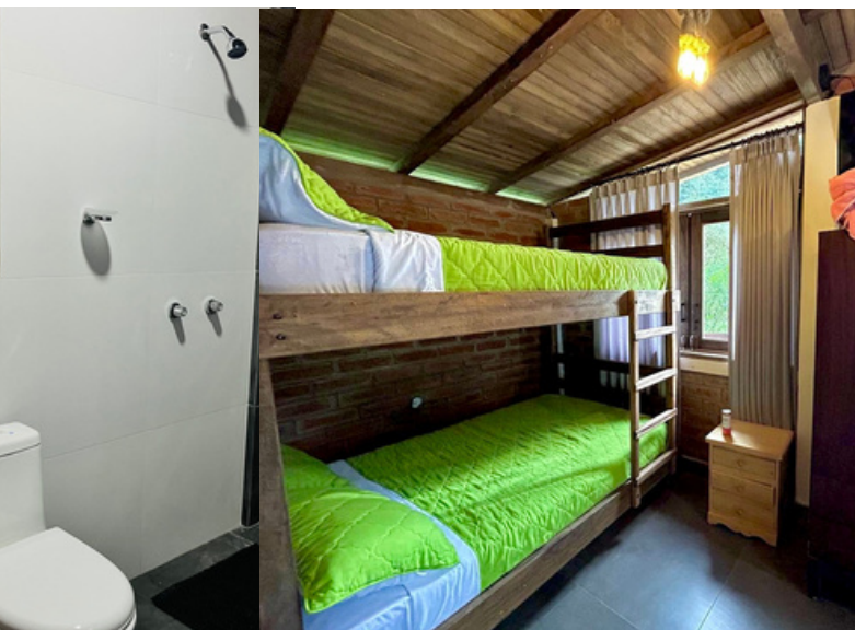
Litera de dos plazas