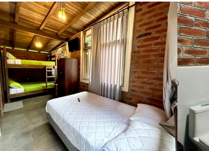
Cama de dos plazas