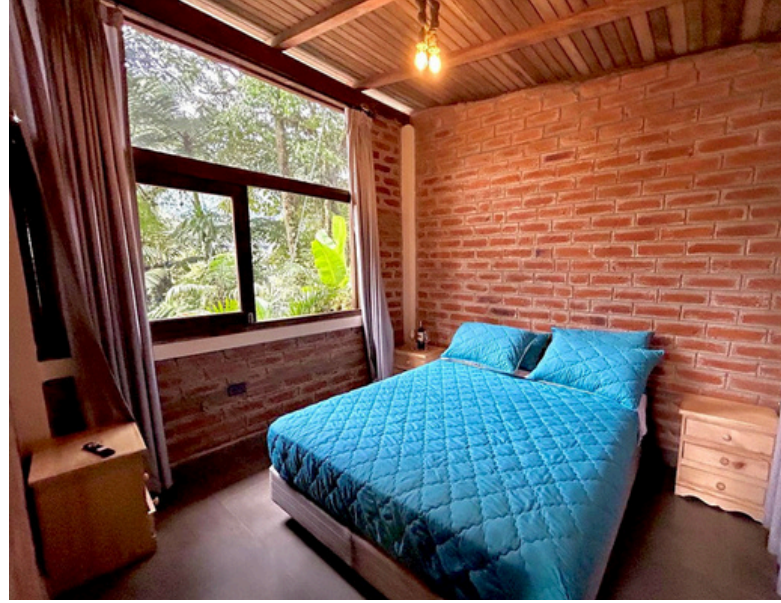
1 Cama de 2 plazas y media Con acceso directo a la naturaleza